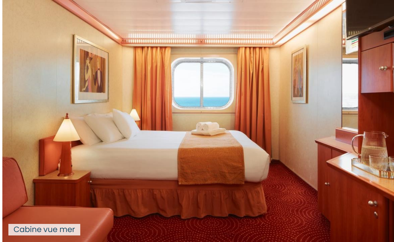
Cabine vue mer