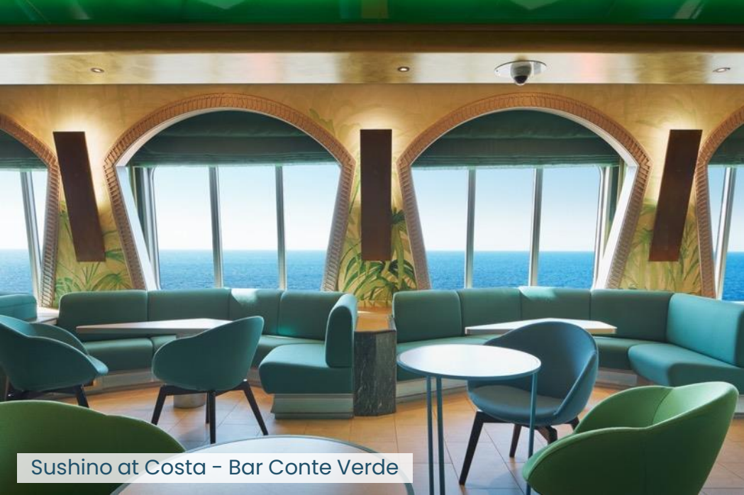
Sushino at Costa - Bar Conte Verde