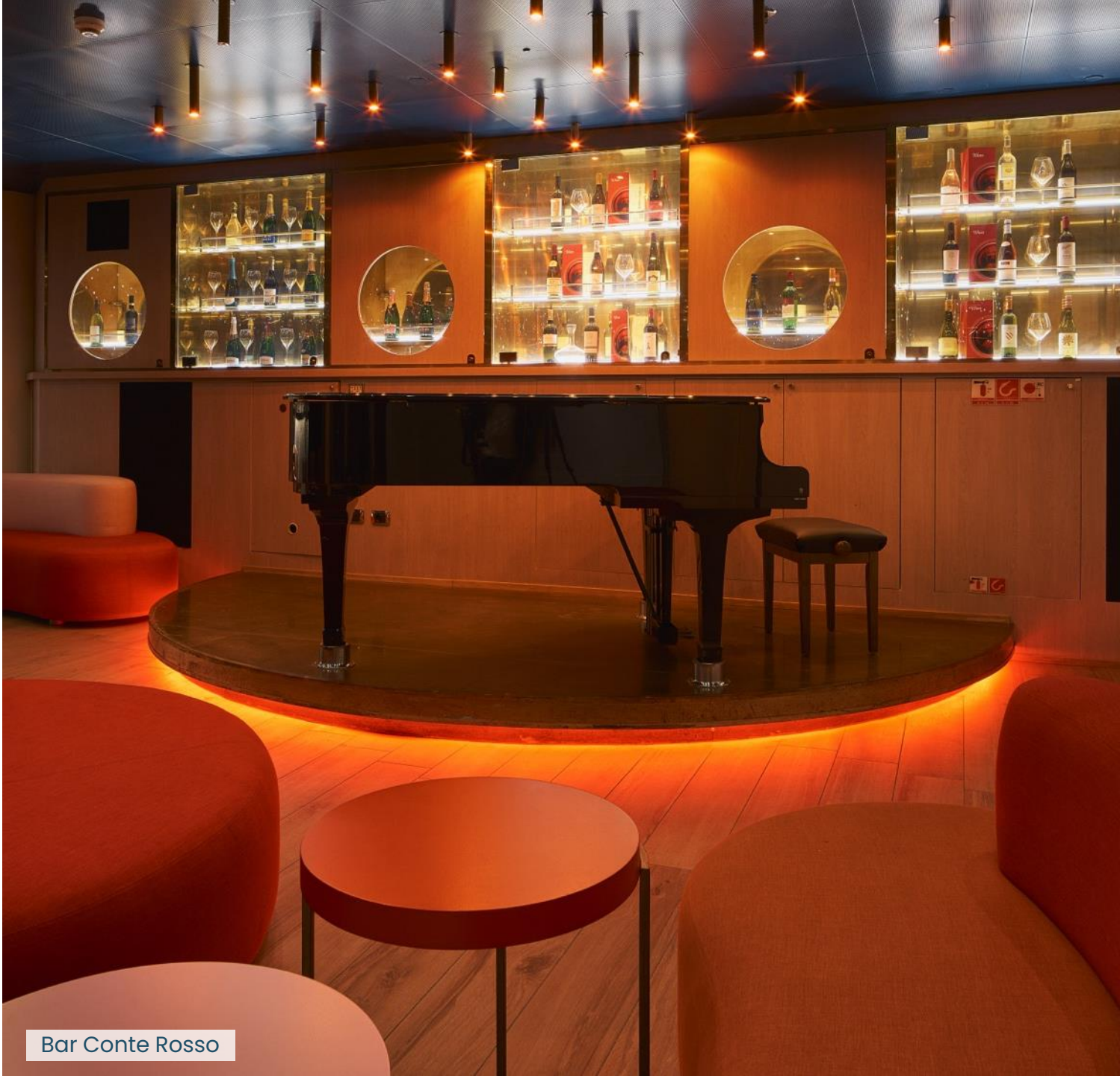
Bar Conte Rosso