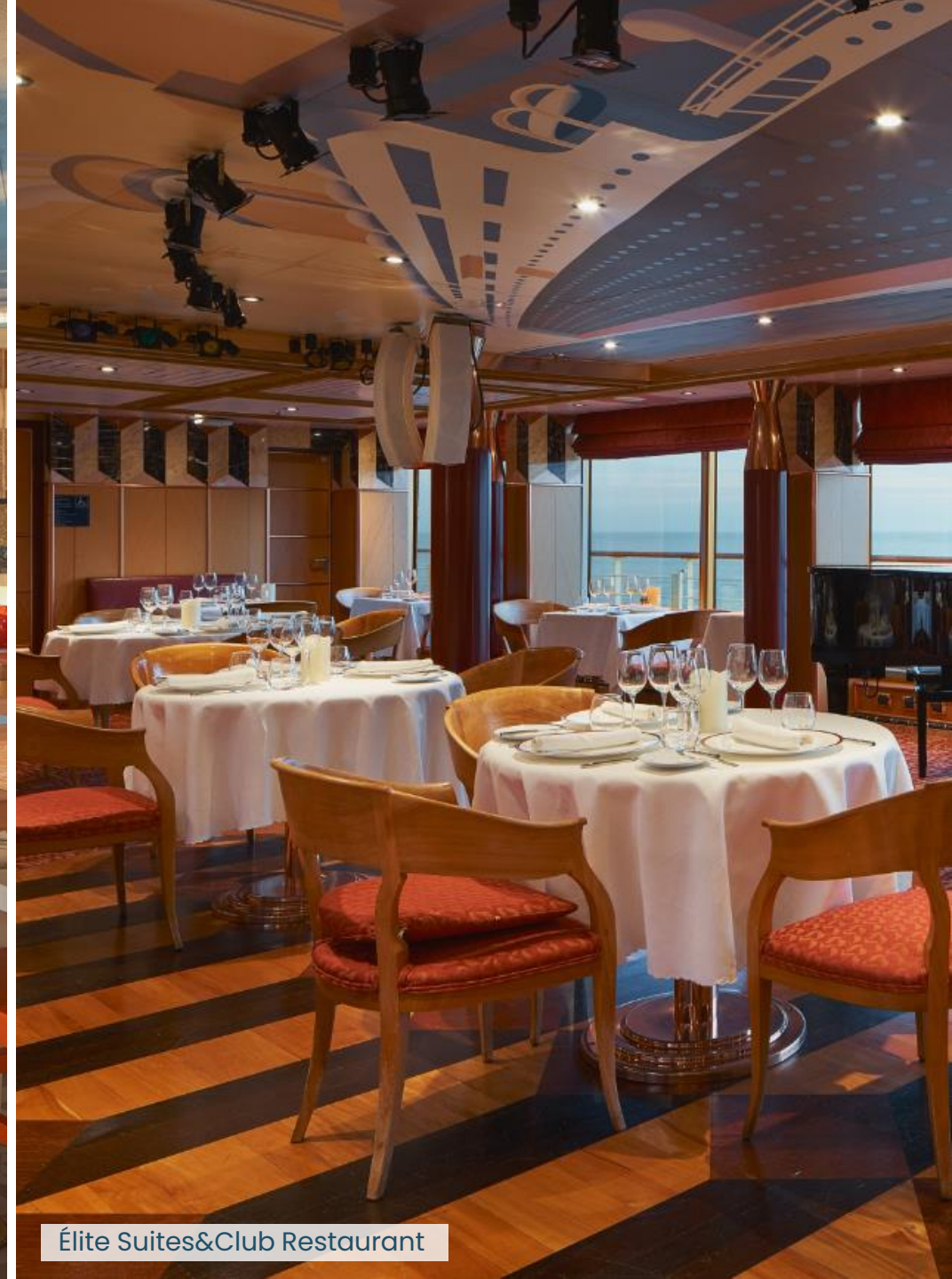
Élite Suites&Club Restaurant