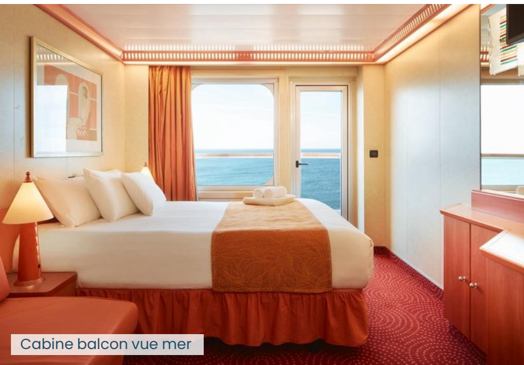
Cabine balcon vue mer